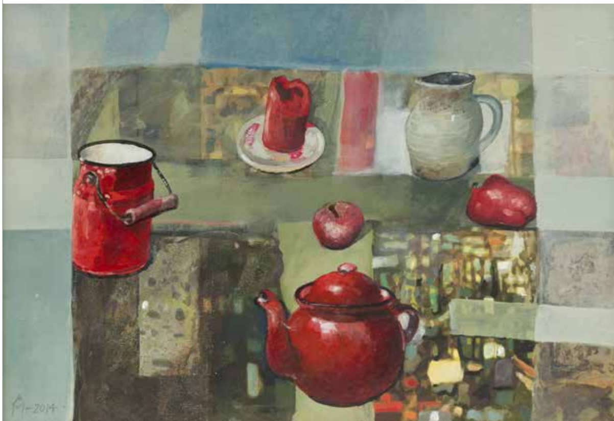
bez tytułu, olej na desce, 70 x 100 cm.