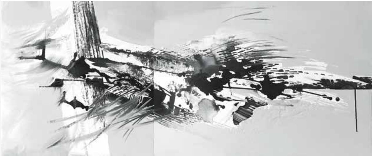
bez tytułu, technika mieszana na płótnie, 50 x 50 cm + 70 x 50 cm