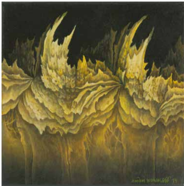
„Drzewo żywota - droga I”, olej na płótnie, 30 x 30 cm.