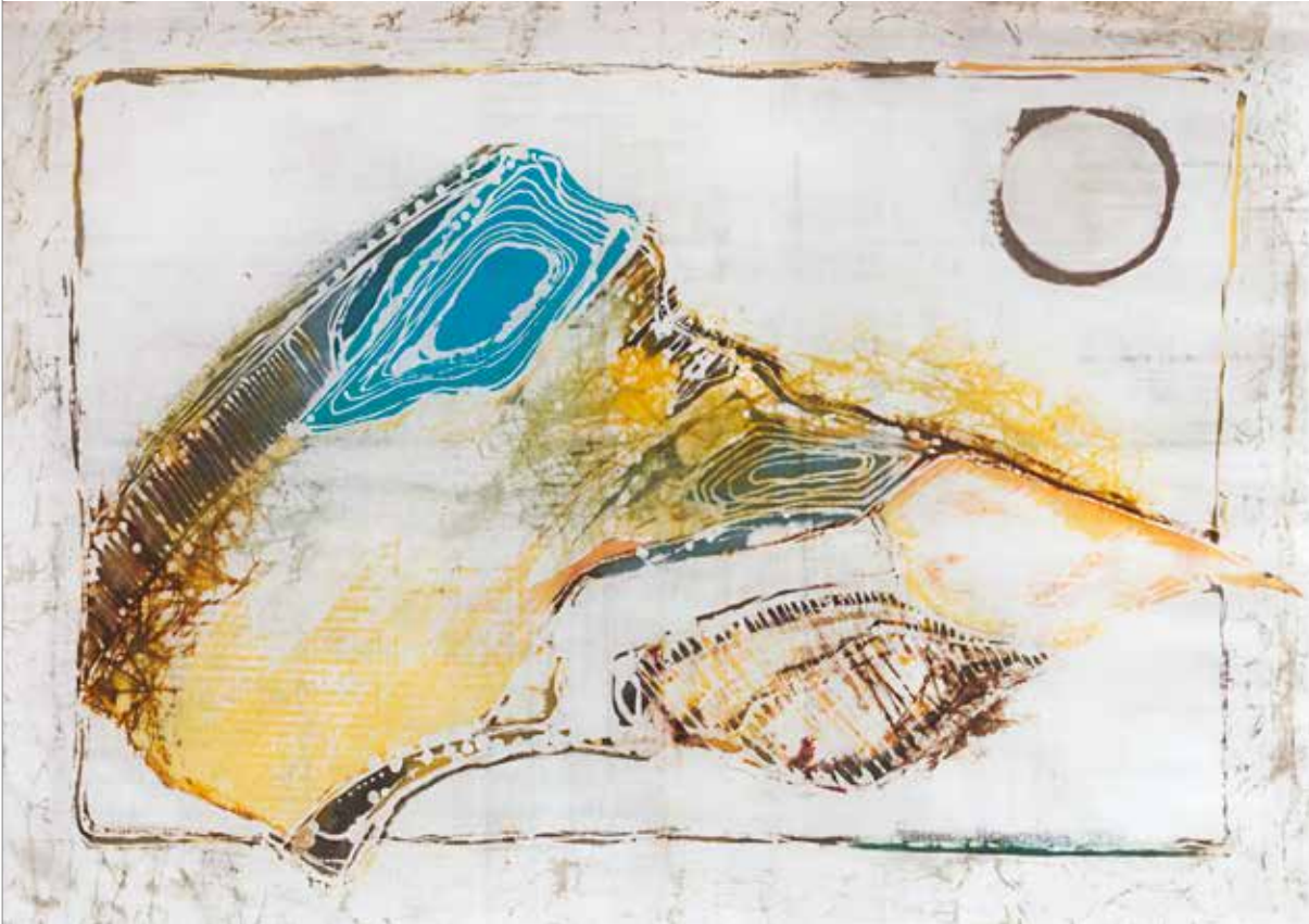
bez tytułu, batik, 70 x 100 cm.