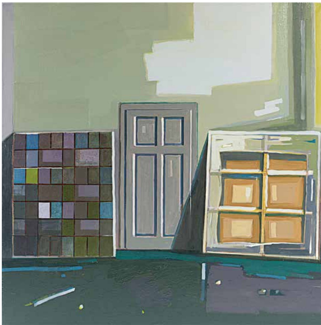
„Obrazy”, olej na płótnie, 90 x 90 cm.