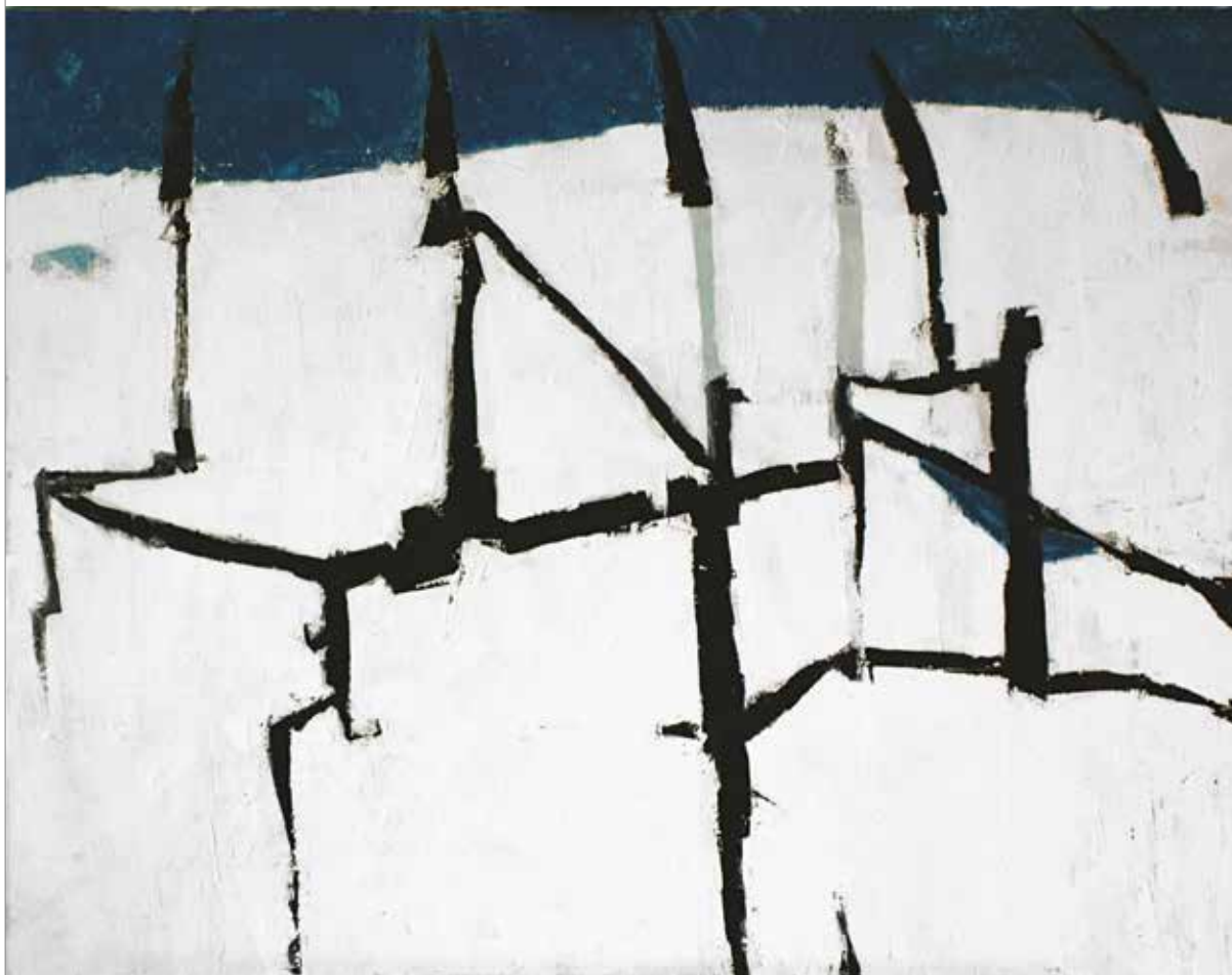
„Katedra”, olej na płótnie, 83 x 116 cm.