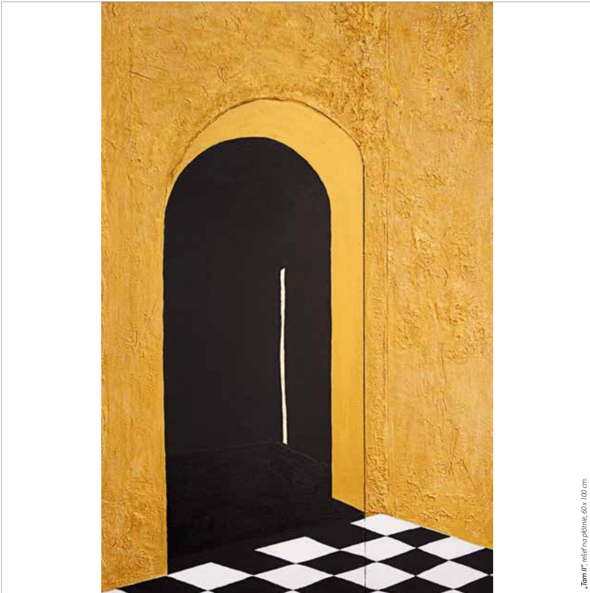
„Tam II”, relief na płótnie, 60 x 100 cm.