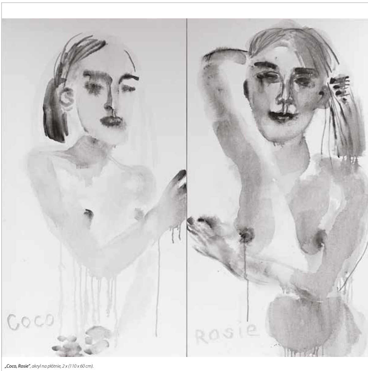
„Coco, Rosie”, akryl na płótnie, 2 x (110 x 60 cm).