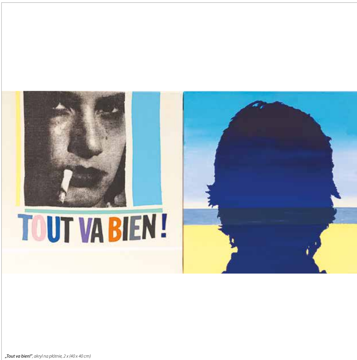
„Tout va bien!”, akryl na płótnie, 2 x (40 x 40 cm)