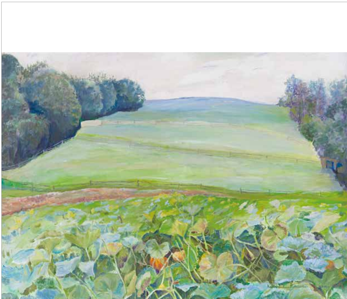
bez tytułu, akryl na płótnie, 70 x 100 cm