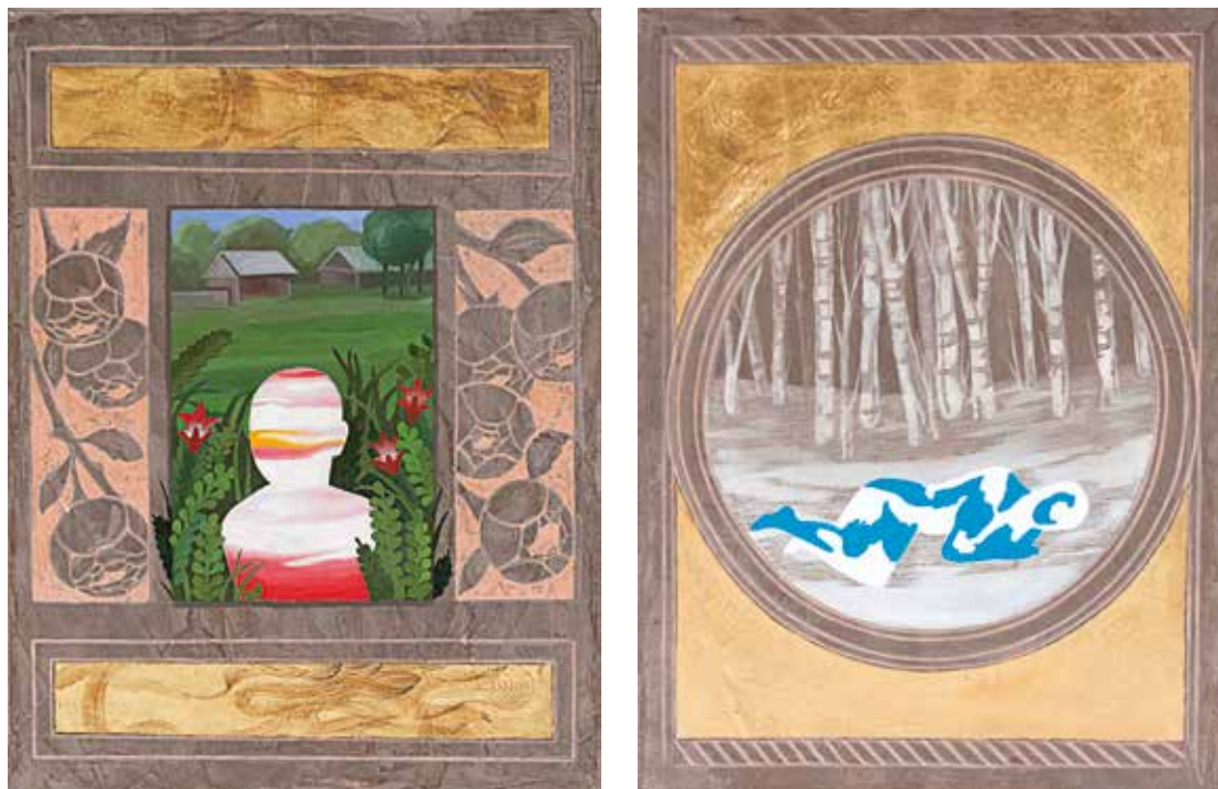
bez tytułu, technika mieszana na płótnie, 2 x (40 x 30 cm).