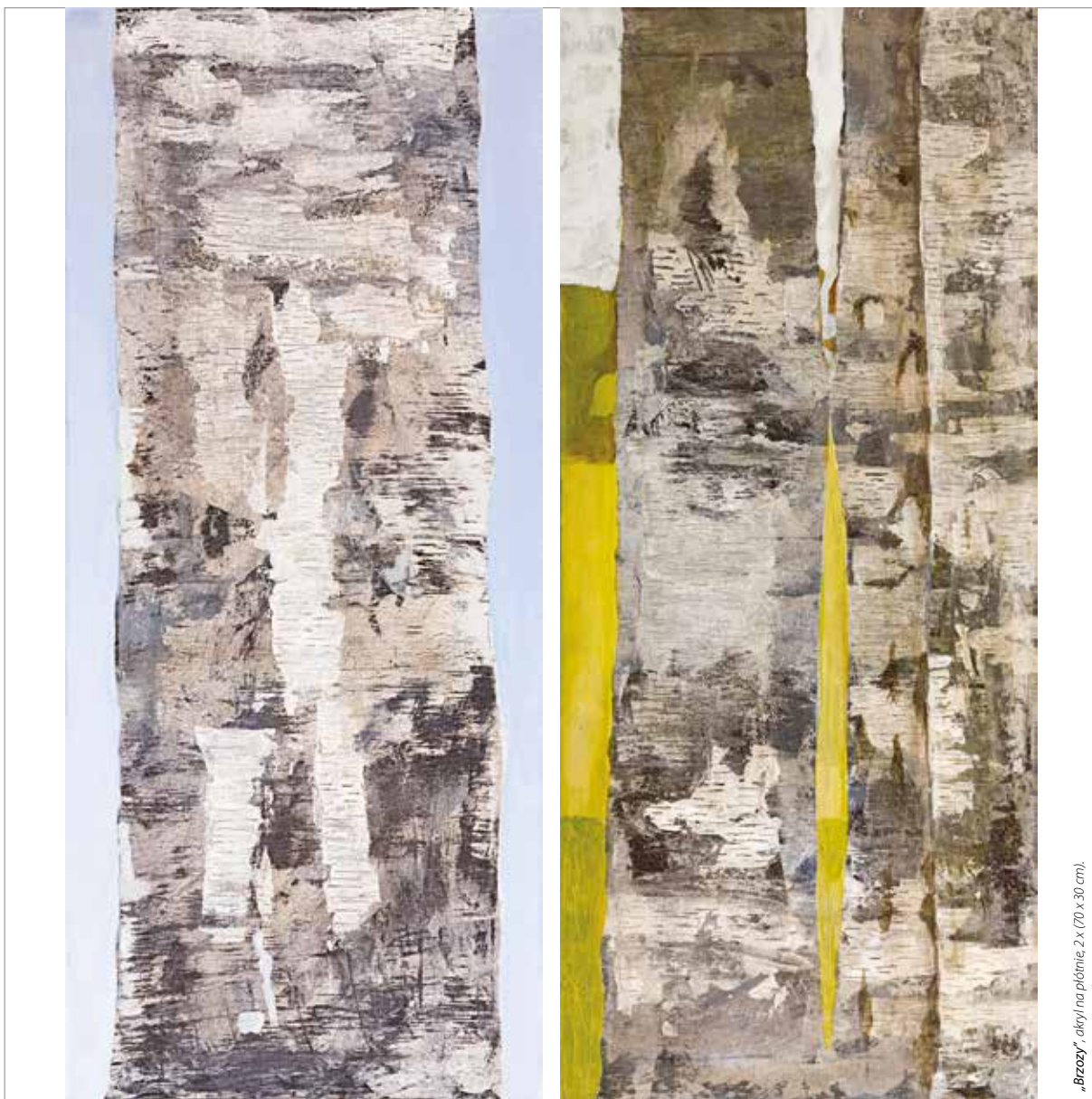
„Brzozy”, akryl na płótnie, 2 x (70 x 30 cm).