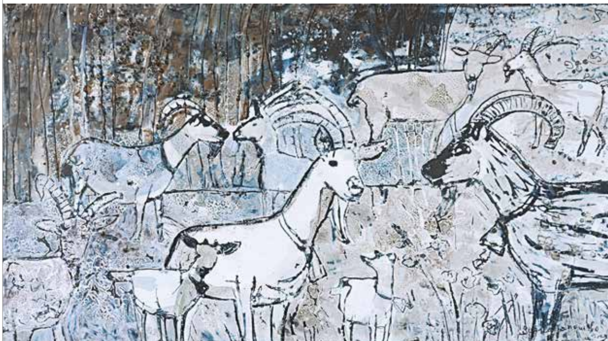
Kozy, emalia na metalu, 40 x 75 cm.