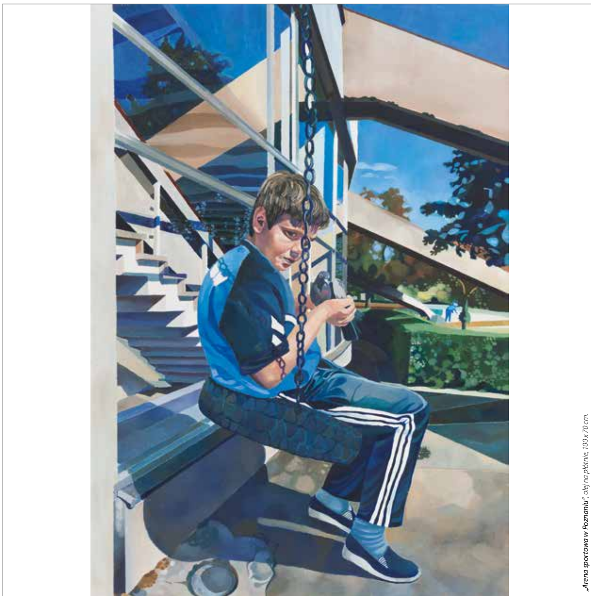
„Arena sportowa w Poznaniu”, olej na płótnie, 100 x 70 cm.