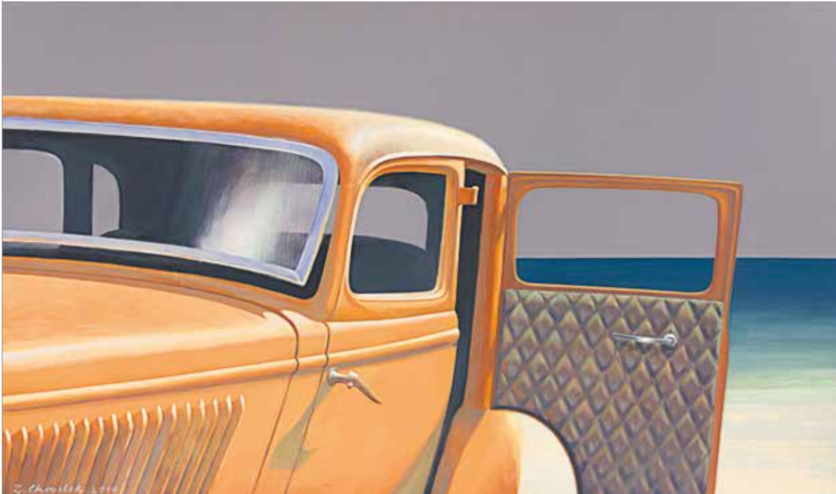
bez tytułu, akryl na płótnie, 70 x 100 cm.